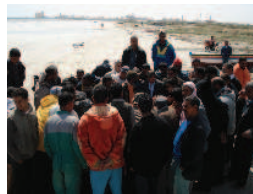
Concertation avec les pêcheurs