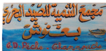
Le panneau du GDP