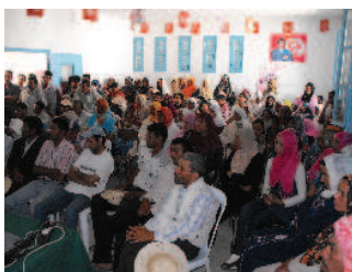
Réunion de concertation