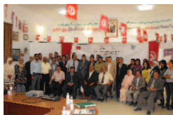
Réunion sur la pêche artisanale dans le golf de Gabès