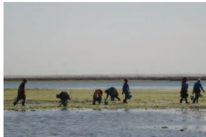
Les femmes à la pêche