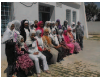
Formation des femmes de Akarit