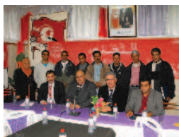
La création du GDP Ghannouch