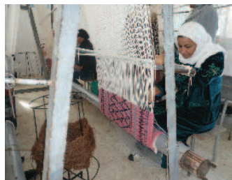
Formation en Tissage