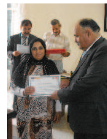
Remise des diplômes de formation