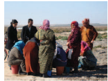
La vente des palourdes