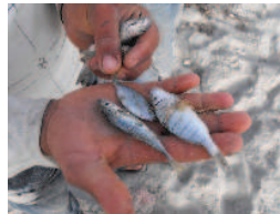
Captures de juvéniles