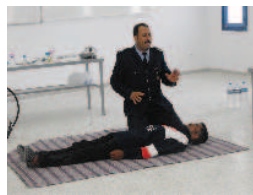
Formation sécurité en Mer