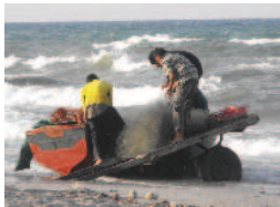
Départ de pêche