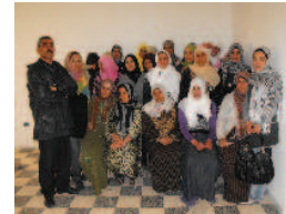
Formation réglementation des pêches