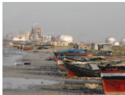
La plage de Ghannouch