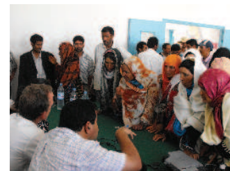
Concertation avec les femmes