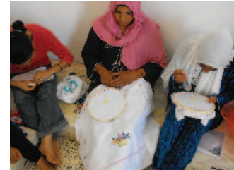
Formation en broderie