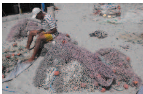
Travail des filets