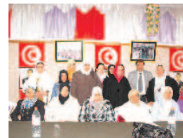
Formation des femmes de Ghannouch